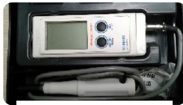
pH țesut muscular