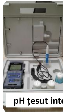
pH țesut intestinal